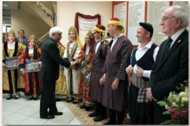
1.4.2017: Ο Πρόεδρος της Δημοκρατίας Προκόπης Παυλόπουλος προσέρχεται στην Ένωση Σπάρτης Μ. Ασίας για την Ημερίδα: «Ελληνισμός και Ορθοδοξία στη Μ. Ασία».

Όπως είπα ήταν δεκάδες οι εθελοντές-μέλη των διοικητικών συμβουλίων του ΚΕ.ΜΙ.ΠΟ. και θα ήταν άδικο να ξεχωρίσω κάποιους. Όλοι ήταν σημαντικοί και είναι καταχωρημένοι στα τεύχη του περιοδικού με τίτλο «ΚΕ.ΜΙ.ΠΟ.». Έγινε συστηματική καταγραφή των αντικειμένων του Μουσείου. Καταχωρήθηκαν 1.500 περίπου αντικείμενα.