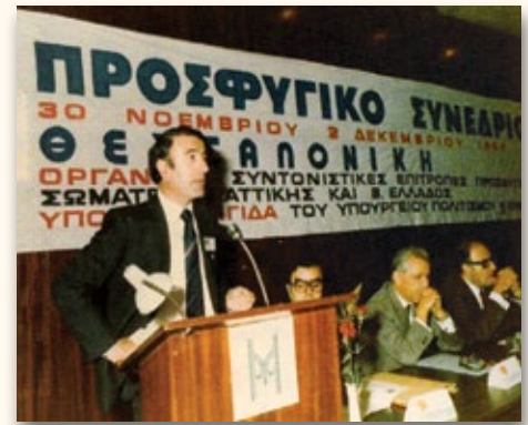
1984 Θεσσαλονίκη: Προσφυγικό Συνέδριο.

Με κέρδισε ο δήμος τώρα! Αν και μπορούσα να μην έχω παραιτηθεί, προτίμησα να μείνω χωρίς υποχρεώσεις να υπηρετήσω το Δήμο, το Δήμο Ν. Ιωνίας, ως δημοτικός σύμβουλος. Έβαλα υποψηφιότητα για τις