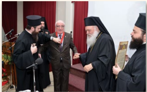
10.1.2016: Απονομή «Ο Χρυσός Σταυρός της Αρχιεπισκοπής»