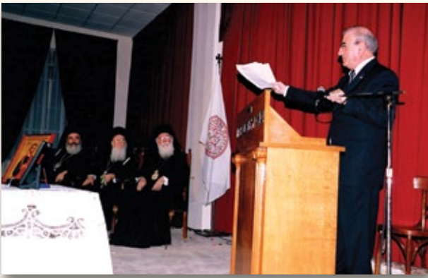
Ο Οικουμενικός Πατριάρχης κ.κ. Βαρθολομαίος τιμάται από την Ένωση Σπάρτης