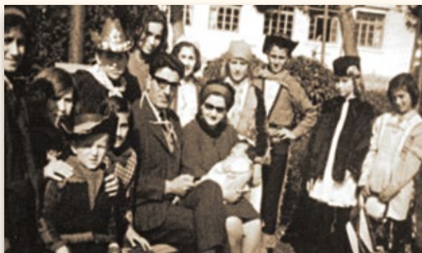
1965: Στην Ξάνθη με τους μαθητές του.