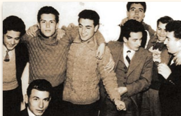
Μόλις έχουν βγει τα αποτελέσματα.

Μαζί με τους μεγαλύτερους και τον πρόεδρο του χωριού και τον παπά προσπαθήσαμε να πείσουμε ότι είχαν γίνει τυχόν λάθη κλπ. κλπ. να γλυτώσει το χωριό! Ως το μεσημέρι το χωριό ήταν ανάστατο. Ευτυχώς τελικά δεν δόθηκε συνέχεια. Είχε νικήσει πανηγυρικά. Ένα τόσο μικρό χωριό που είχε δώσει 70 ΟΧΙ!