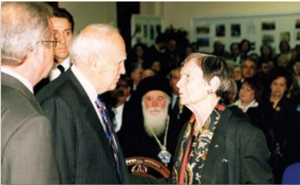
2005: Απόδοση τιμής από το ΚΕ.ΜΙ.ΠΟ. στην Ελένη Γλύκατζη-Αρβελέρ. Την αποδίδει ο τότε Πρόεδρος της Δημοκρατίας Κάρ. Παπούλιας.

Επιτροπές και Δημοτικές Επιτροπές Παιδείας. Καθημερινό τρέξιμο στον Οργανισμό Σχολικών Κτιρίων (Ο.Σ.Κ.) για την ανέγερση νέων διδακτηρίων. Η Νέα Ιωνία εκείνα τα χρόνια είχε 5-6 ολοκαίνουργια σχολεία. Μοιράστηκαν οι μαθητές σε περιοχές ώστε να πηγαίνουν τα παιδιά στο κοντινότερο σχολείο. Κατανέμονται σωστά τα χρήματα στα σχολεία και καλείται κάθε καλοκαίρι η Δημοτική Επιχείρηση ν' ανακαινίσει τα σχολεία.