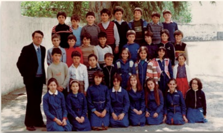
1977: Στο 3ο Δημοτικό Σχολείο Ν. Ιωνίας με τα παιδιά της Ε' τάξης.