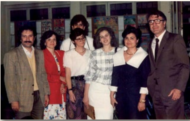
1989 Αχαρνές: Ως Σχολικός Σύμβουλος Π.Ε. με την Οργανωτική Επιτροπή του Συνεδρίου.