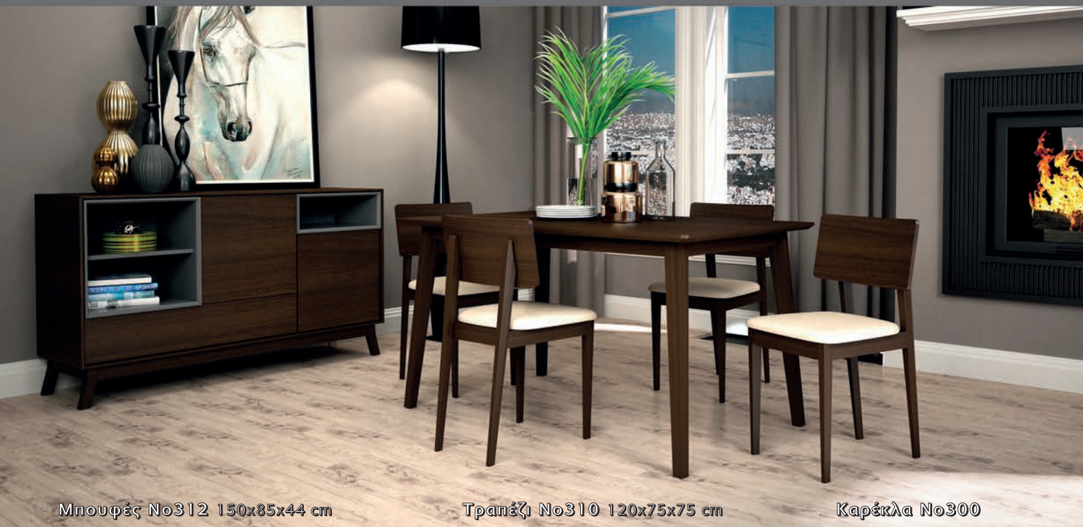
Μπουφές Νο312 150x85x44 cm