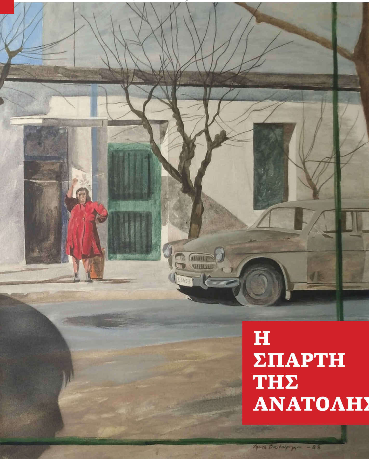
πίνακας της Χρύσας Βαυδούρογλου που απεικονίζει προσφυγική κατοικία τη δεκαετία του '60