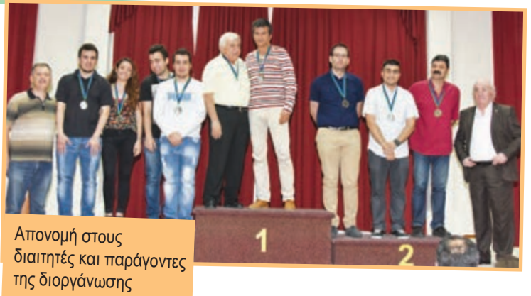
Απονομή στους διαιτητές και παράγοντες της διοργάνωσης