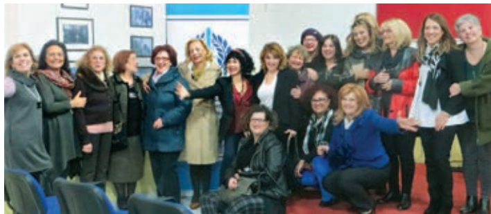
Από την εκδήλωση της Αντικαρκινικής Εταιρείας για την αποστολή τροφίμων στους πλημμοροπαθείς της Μάνδρας Αττικής.