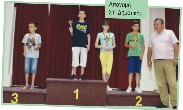
Απονομή ΣΤ' Δημοτικού