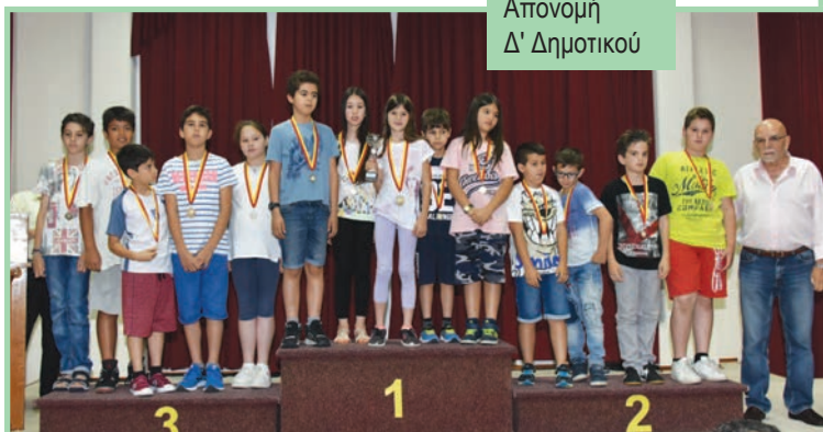
Απονομή Δ' Δημοτικού