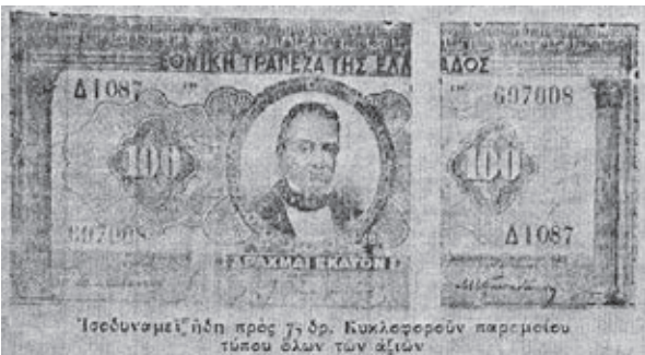
Το κατοστάρικο "κουρεμένο"

Στις 24 Ιανουαρίου 1926, ο Θ. Πάγκαλος λαμβάνει ένα μέτρο που χαρακτηρίστηκε ως « ληστεία μετά φόνου όλου του λαού ». Με διάταγμα οριζόταν, ότι τα κυκλοφορούντα χαρτονομίσματα θα κόβονταν με το ψαλίδι κατά το 1/4 και η αξία τους θα μειώνονταν κατά 25%. Το Κράτος θα μπορούσε να τυπώσει χαρτονόμισμα ίσης αξίας χωρίς να αυξηθεί ο όγκος του κυκλοφορούντος χρήματος. Με τη ρύθμιση αυτή το Κράτος άρπαξε από τις τσέπες των Ελλήνων καταθετών 1.250.000.000 δρχ. ενώ για τα παρακρατηθέντα χρήματα τους έδωσε ομολογίες που θα τους απέφεραν τόκο 5%. Ο καταθέτης έχανε στο χιλιάριο 250 δραχμές και σε αντιστάθμισμα θα έπαιρνε 15 δραχμές το χρόνο από τον τόκο. Κανονικό «κούρεμα των καταθέσεων» κατά 25%» θα το ονομάζαμε σήμερα.