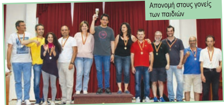
Απονομή στους γονείς των παιδιών