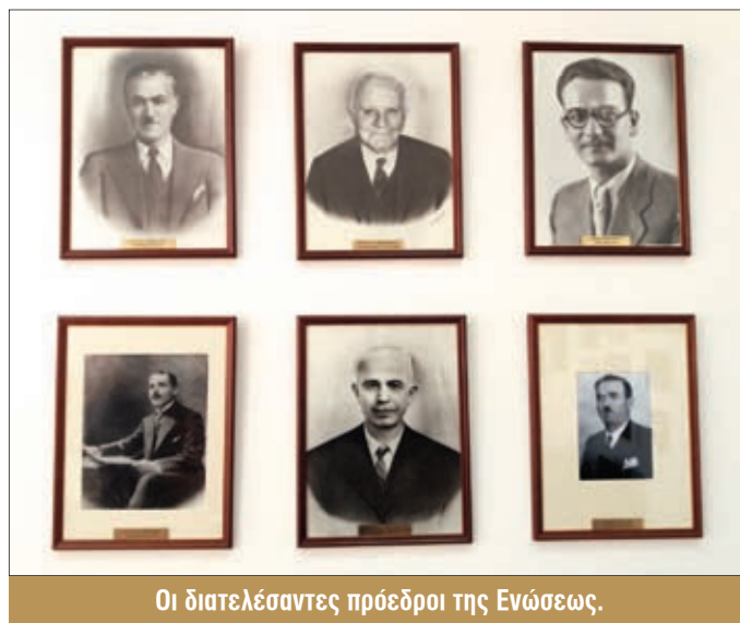
Οι διατελέσαντες πρόεδροι της Ενώσεως.

Έτσι έδωσαν ανανεωμένοι "το παρών" οι διατελέσαντες Πρόεδροι, ένας επίτιμος πρόεδρος και δύο αντιπρόεδροι.