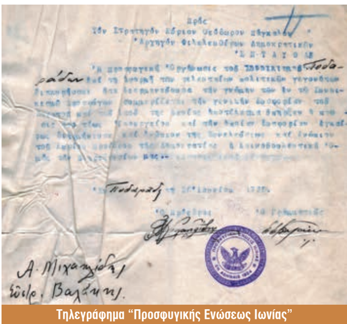
Τηλεγράφημα «Προσφυγικής Ενώσεως Ιωνίας»

Ο Πάγκαλος αποστασιοποιείται από το Βενιζελικό στρατόπεδο, στις 29 Σεπτεμβρίου 1925 διαλύει την Δ' Συντακτική Συνέλευση και προκηρύσσει εκλογές για τον Ιανουάριο του 1926, που δεν πραγματοποιούνται ποτέ, γιατί στις 4 Ιανουαρίου 1926 δηλώνει ότι «αναλαμβάνει προσωπικά την άσκηση της νομοθετικής και της εκτελεστικής εξουσίας» επιβάλλοντας αποκάλυπτα δικτατορικό καθεστώς.