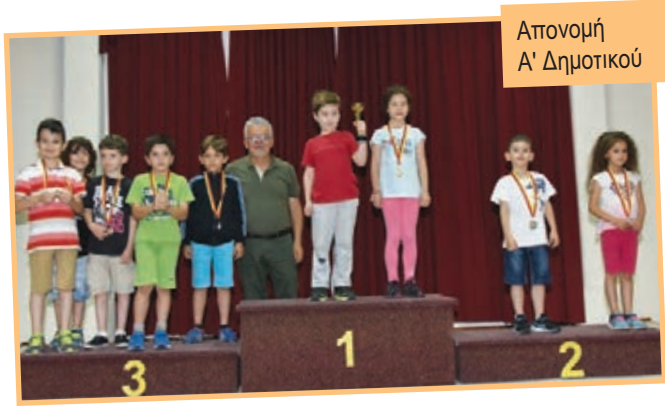
Απονομή Α' Δημοτικού