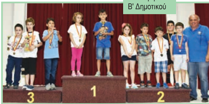
Απονομή Β' Δημοτικού