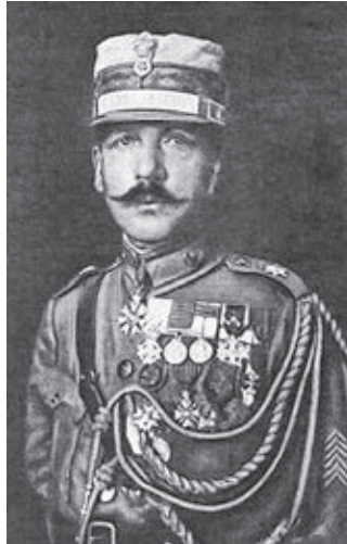
Στρατηγός Θεοδ. Πάγκαλος

Ο στρατηγός Θεοδ. Πάγκαλος, ικανός αξιωματικός και με άριστα προσόντα, που είχε επανέλθει στην ενεργό υπηρεσία μετά την Μικρα-