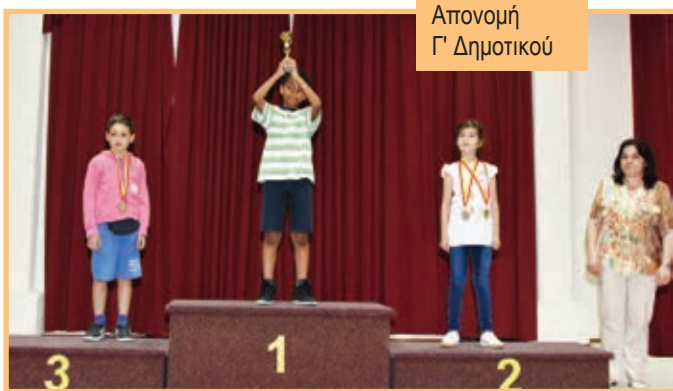
Απονομή Γ' Δημοτικού