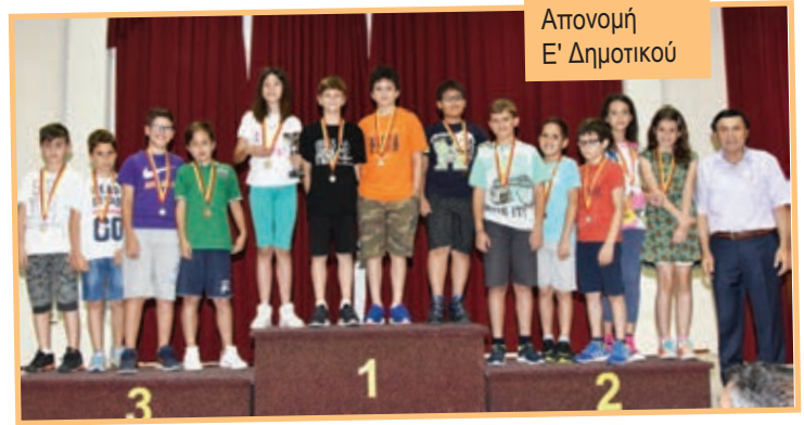
Απονομή Ε' Δημοτικού