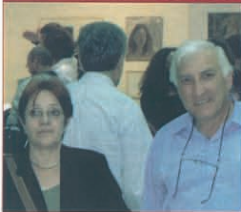
Η Γ. Γραμματέας του Κ.Κ.Ε. η κα Αλέκα Παπαρήγα στο Εκθετήριο της Ενώσεως, δίπλα της ο κ. Ν. Χατόγλου.

Τη Δευτέρα, 16 Μαΐου 2005, το βράδυ επισκέφθηκε την Ένωση η Γεν. Γραμματέας του Κ.Κ.Ε κα Αλέκα Παπαρήγα για να δει την Ομαδική Έκθεση Ζωγραφικής των 26 καλλιτεχνών που οργανώθηκε σε χώρους του εκθετηρίου μας.