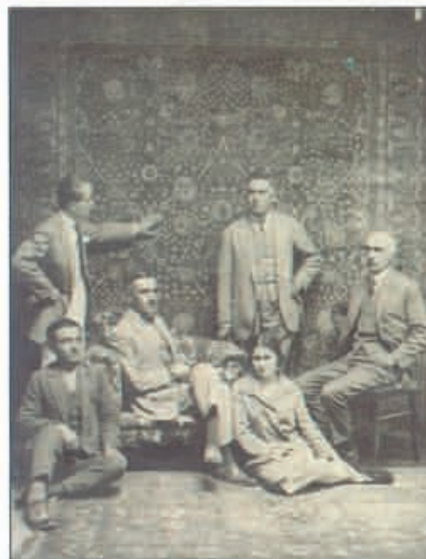
1925: Οι Σπαρταλήδες αναπτύσσουν αμέσως την Ταμπουργιά

• Οι Πισίδες, φύλο με καθαρά ελληνικές αρετές (φιλοπατρία, αυτοθυσία) θα επιβιώσουν των πολέμων των διαδόχων του Μεγάλου Αλεξάνδρου και θα αναδείξουν σημαντικές πολιτείες κατά τη Ρωμαϊκή περίοδο, με πρώτη την πασίγνωστη κι από τις πορείες του Αποστόλου Παύλου, Μικρή Αντιόχεια, την Πισιδική Αντιόχεια και