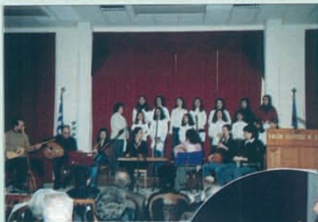
Το Ωδείο Περισοπού "Εν οργάνοις" στη σκηνή της Ενώσεως.

* Αύγουστος: Εκδρομή - προσκύνημα στις αξέχαστες πατρίδες.