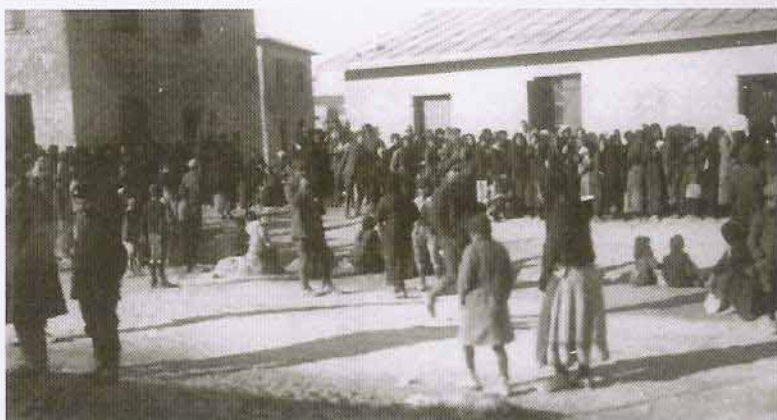
Πέα Ιωνία 1923 - 24