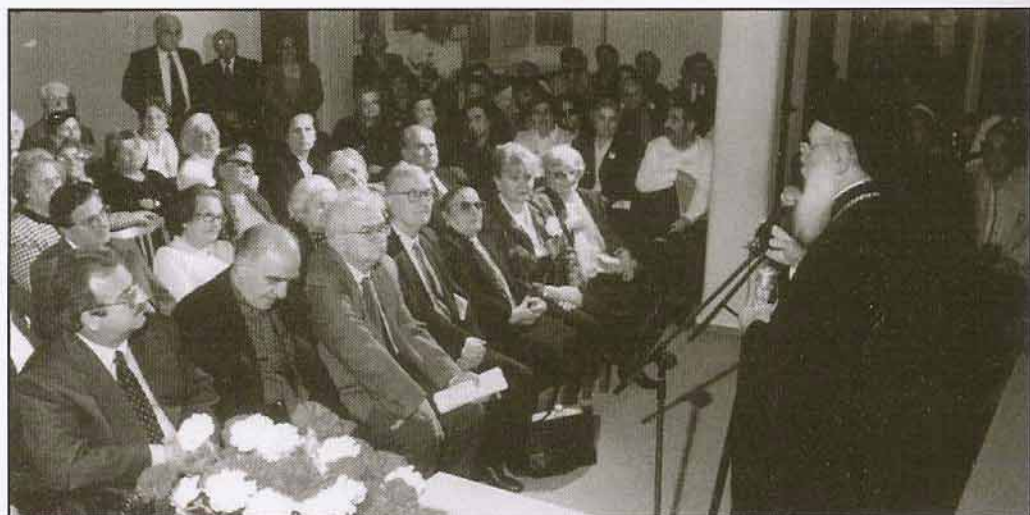
Ο Σεβασμιότατος Μητροπολίτης μας κ. Κωνσταντίνος ομιλεί κατά την Επίσημη Εορτή της Ενώσεως.

νια πριν από την καταστροφή" γ/ εκτέλεση Βυζαντινών ύμνων από τη Βυζαντινή χορωδία της Ι. Μητροπόλεώς μας υπό τη Δ/νση του κ. Κων/νου Ηλιάδη και δ/ εγκαίνια έκθεσης ζωγραφικής με γραμματόσημα από τον παγκοσμίως γνωστό, Σπάρταλη δημιουργό κ. Στάθη Λεοντιάδη.