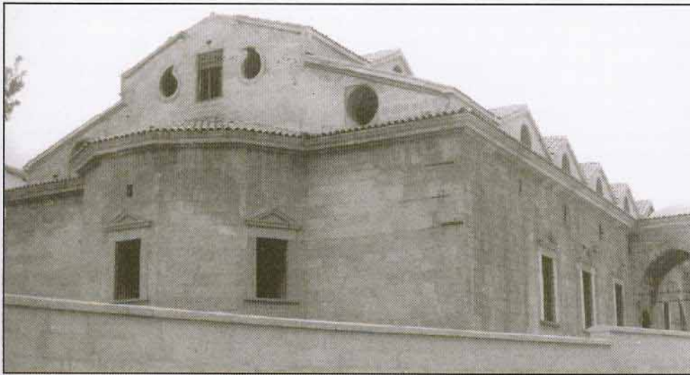
Η ανατολική πλευρά του αναπαλαιωθέντος ναού των Εισοδίων της Θεοτόκου. Η φωτογραφία είναι Ιουνίου του 1999.

Ο ι εξελίξεις στις Ελληνοτουρκικές σχέσεις στο τέλος του τελευταίου χρόνου της χιλιετίας και στη χαραυγή του νέου υπήρξαν θα έλεγε κανείς ραγδαίες και καταλυτικές.