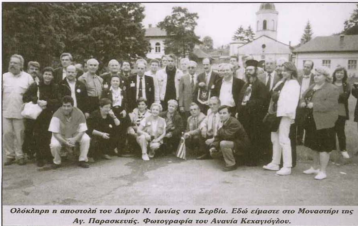
Ολόκληρη η αποστολή του Δήμου Ν. Ιωνίας στη Σερβία. Εδώ είμαστε στο Μοναστήρι της Αγ. Παρασκευής.

Ο καιρός που πέρασε δεν είναι πολύς. Όμως τα γεγονότα που μεσολάβησαν ήταν τέτοια που σε πολλών τη μνήμη έχει κι' όλας ξεθωριάζει μια τολμηρή πρωτοβουλία του Δήμου Ν. Ιωνίας και πολλών φορέων της πόλης - ανάμεσα από τους οποίους φυσικά δεν θα μπορούσε να λείψει η Ένωσή μας - να επισκεφτούν το Βελιγράδι, κομίζοντας ανθρωπιστική βοήθεια την ώρα που οι Νατοϊκές βόμβες έπεφταν βροχή. Μιλάμε για το караβάνι της ανθρωπιάς και της αλληλεγγύης για το δεινώς, τότε, δοκιμαζόμενο ομόθηρσο έθνος, των Σέρβων, που ξεκίνησε από τη Ν. Ιωνία το πρωί της 23 του Μάη και γύρισε πίσω έπειτα από ένα φοβερά κοπιαστικό ταξίδι, το απόγευμα της 26ης του ίδιου μήνα.