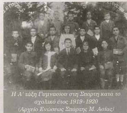
Η Α' τάξη Γυμνασίου στη Σπάρτη κατά το σχολικό έτος 1919-1920

Ένωση Σπάρτης Μικράς Ασίας, Αλατοάτων 27, Ν. Ιωνία Τηλ.: 27 70 978