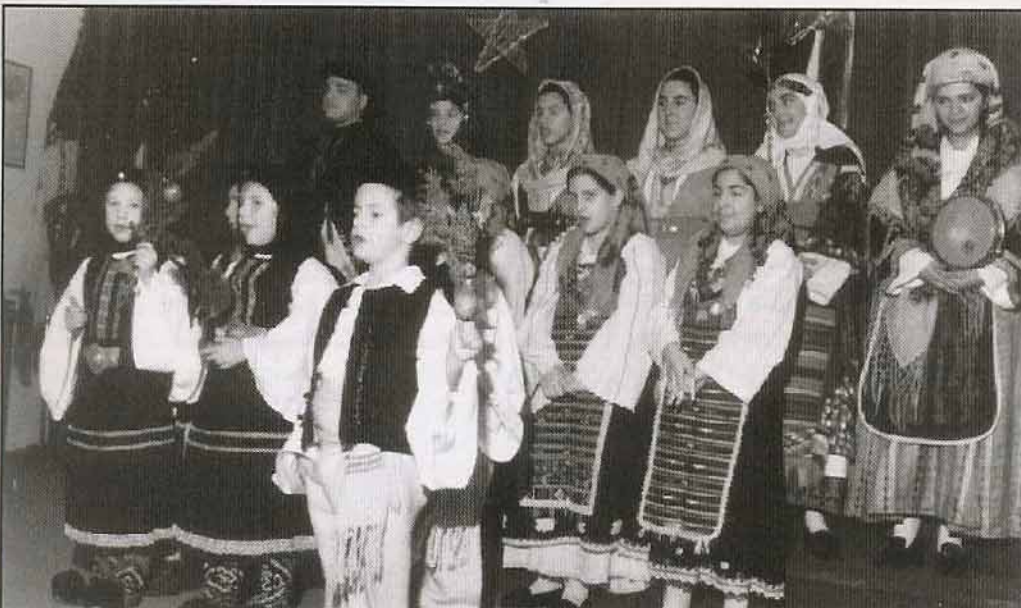
Τα παιδάκια του Λυκείου Ελληνίδων ψάλλουν τα κάλαντα.

Στους πρώτους δόθηκαν «φακελάκια» που περιείχαν από 80.000 δραχμές, στους δεύτερους από 50.000 δραχμές. Τους πρώτους βράβεισαν όλα τα μέλη του Δ.Σ. και η κα Δομνάκη , τους άλλους οι επίσημοι.