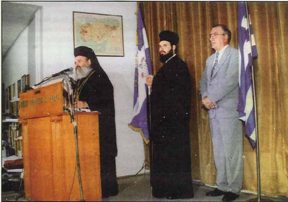
Ο Αρχιεπίσκοπος Αθηνών και Πάσης Ελλάδος κ.κ. Χριστόδουλος στο βήμα της Ενώσεώς μας

Ο ΑΡΧΙΕΠΙΣΚΟΠΟΣ ΑΘΗΝΩΝ & ΠΑΣΗΣ ΕΛΛΑΔΟΣ κ.κ. ΧΡΗΣΤΟΔΟΥΛΟΣ ΣΤΗΝ ΕΝΩΣΗ ΜΑΣ ΕΙΠΕ: