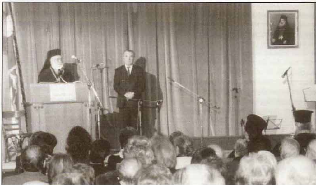
Ο Σεβασμιότατος Μητροπολίτης μας κ. κ. Κωνσταντίνος μιλάει από το θήμα της Ενώσεως για τον Πατριών Μελέτιο, του οποίου η κορνίζα είναι αναρτημένη στο μέσο της σκηνής.

Ύστερα από επανειλημμένες συνεδριάσεις των