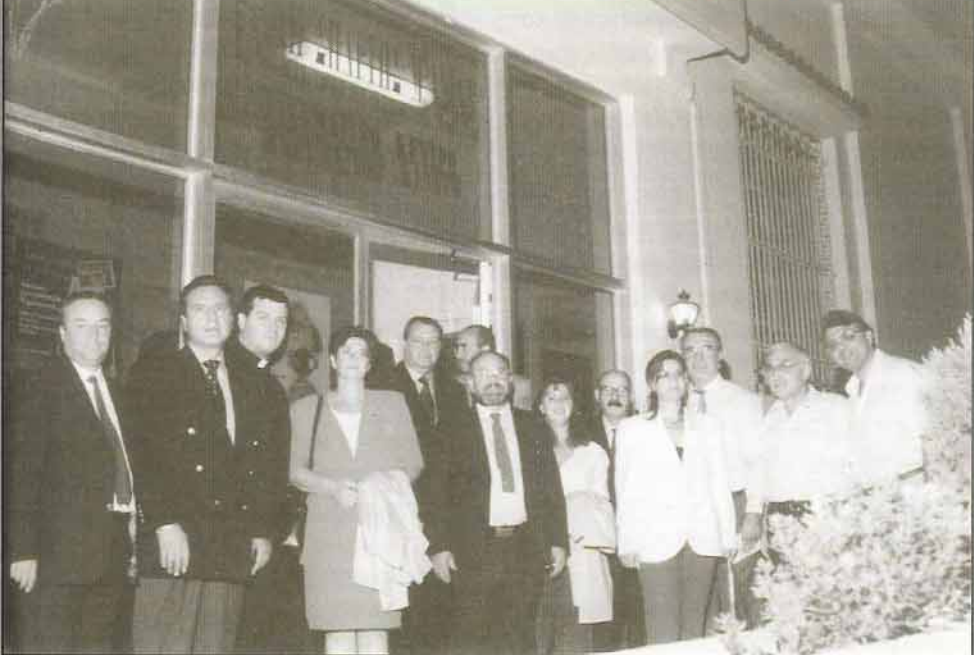
Η Ιταλική Αντιπροσωπεία της MARTINA FRANCA με μέλη της Ένωσης Σπάρτης Μ. Ασίας και Δημοτικούς Συμβούλους της Νέας Ιωνίας, μπροστά από το Πνευματικό Κέντρο της Ένωσης κατά τα εγκαίνια της Έκθεσης Φωτογραφίας των Πατρίδων της Ανατολής.

Α ν ήθελε να κάνει κάποιος έναν απολογισμό, σε γενικές γραμμές, για τη δραστηριότητα της Ενώσεώς μας στο 1997, στην επετειακή χρονιά που μας γύρισε πίσω στο 1922, το μαύρο 1922 και τη μεγάλη Καταστροφή, θα μπορούσε ν' αναφερθεί σε 4 σημαντικές ημερομηνίες - σταθμούς: