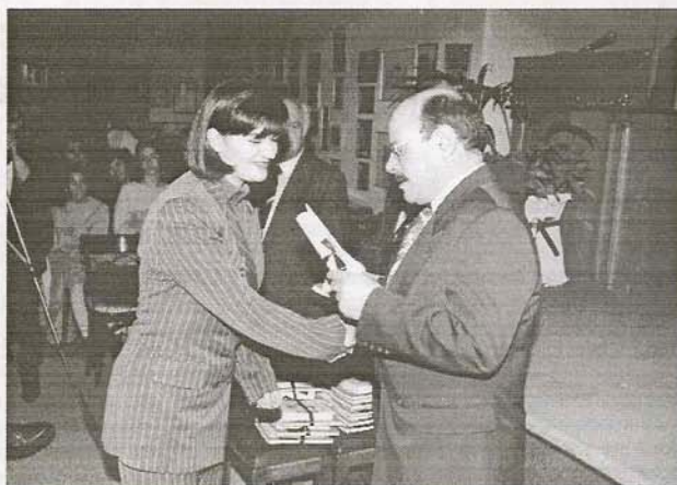
Ο δήμαρχος Ν. Ιωνίας κ. Η. Μπουρδούκος βραβεύει την πρώτη νέα της πόλης που επέτυχε στα Α.Ε.Ι.