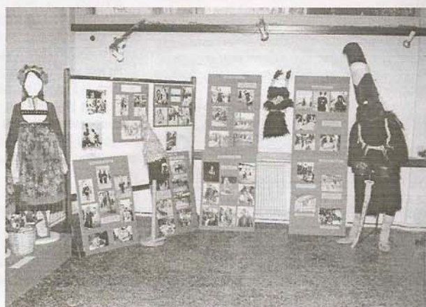
Από την Έκθεση του Λυκείου των Ελληνίδων