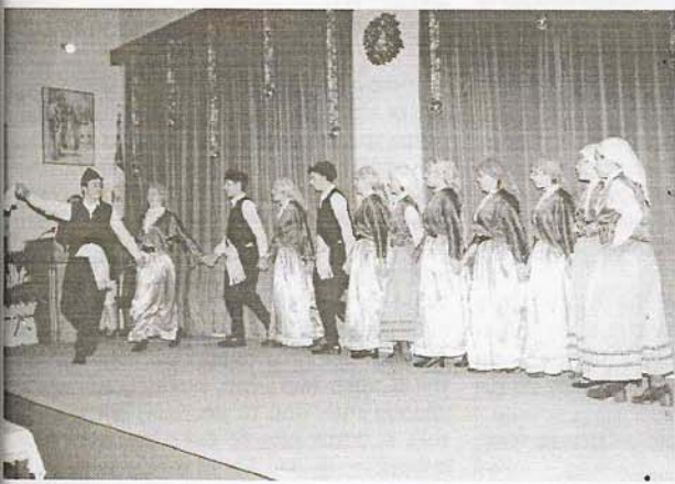
Το χορευτικό του Μαυρόλογου Σερρών