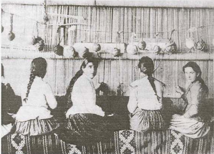
Σπαρτιαλές δουλεύουν στο χαλί

* Η Μαριάνθη Καπλάνογλου είναι Σπαρταλιά τρίτης γενιάς. Λιχιστός του Τριμηνατού Ιστορίας και Αρχαιολογίας της Φιλοσοφικής Σχολής Αθηνών. Διπλωματούχος Πανεπιστημίου Παρισιών και υπότροφος του Ι.Κ.Υ. Έχει συμμετάσχει σε πολλά συνέδρια κι έχει κυκλοφορήσει πέντε μυθιστορημάτά της για παιδιά από το 1992 έως σήμερα.