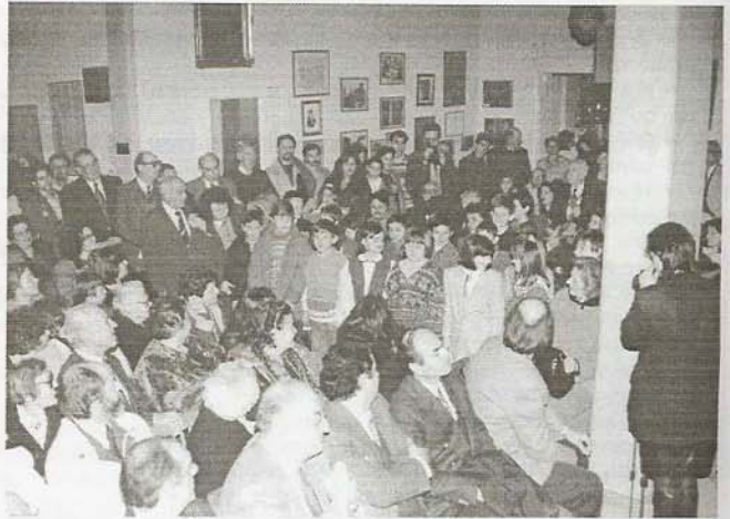
Τα προσφυγόπουλα της Κρίνα τραγουδούν τα κάλαντα της πατρίδας τους