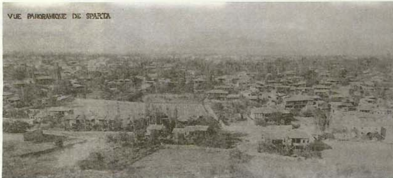
Η Σπάρτη χιονισμένη, πριν από την Καταστροφή (από το μουσείο της Ενάωσης)

Καταλαβαίνει το γιατί ο "Όικος Εφραίμωγλου" καθιερώθηκε σαν το "Ανατολικός στο χαλί"