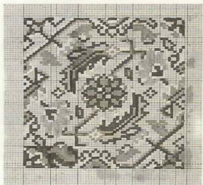
Σχέδιο χειροποίητου χαλιού.