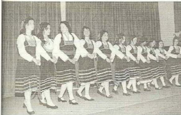
Ένα από τα χορευτικά τμήματά μας.