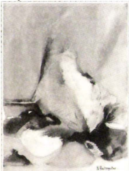
Η αφίσα του κ. Νίκου Βουλγαρέλη. Η Έκθεση αυτή θα εγκαινιαστεί στις 3 του Μάη και θα λήξει στις 12.