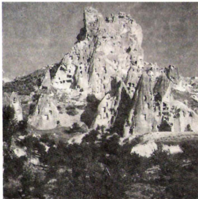
Από το καλαίσθητο ημερολόγιο των Αδελφοτήτων Προκοπιέων «Όσιος Ιωάννης ο Ρόσσος» Τυπική όψη λαξευμένων κατοικιών Καππαδοκίας (13ος αιώνας)

«Ν' αναγνωριστεί η γενοκτονία του ποντιακού ελληνισμού τόσο από τους διεθνείς οργανισμούς όσο και από την Τουρκία καθώς και οι διωγμοί και τα βασανιστήρια που υπέστη και συνεχίζεται να υφίσταται ο ελληνισμός της Κωνσταντινούπολης, της Μικράς Ασίας, της Ίμβρου και της Τενέδου».