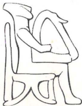
Το σήμα του θεσμού «Μουσική Άνοιξη» Σχέδιο του κ. Ιωσήφ Πολυκάρπου

Το Διοικ. Συμβούλιο της Ενώσεως ευχαριστεί ολόθερμα όλους όσοι πήραν και παίρνουν μέρος, με τον ένα ή τον άλλο τρόπο, στην επιτυχία των εκδηλώσεων.