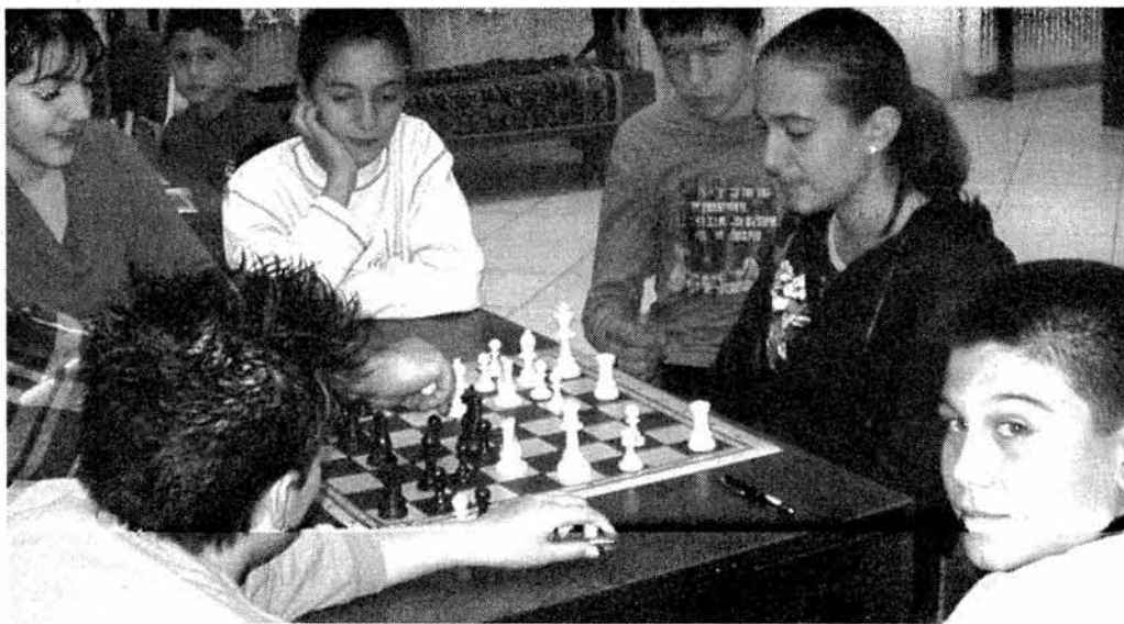
Φωτογραφία από το Τμήμα Σκακιού της Ένωσης